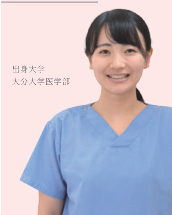
出身大学 大分大学医学部

大分岡病院で研修を始めて約2カ月が経過しましたが、毎日楽しく充実した日々を送っています。まだ医師としても社会人としても未熟な面が多いですが、先生方をはじめ、多くのスタッフの皆さんに支えていただき日々の業務に励んでいます。診療科ごとの研修に加えて、レクチャーや、手技のトレーニング、週1回の救急当番など、この2カ月で実りある経験を多くさせていただき、これからの医師のキャリアの基盤になり得ることと思います。後輩の皆さんと一緒に研修できるのを楽しみにしています。