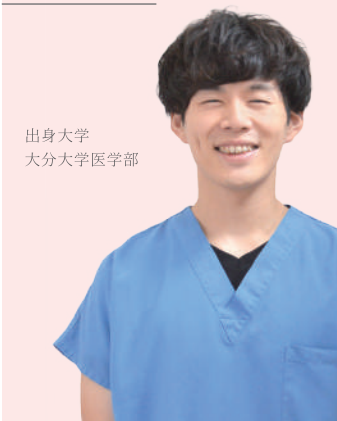
出身大学 大分大学医学部

来年から研修が始まる学生の皆さんは、どこの研修病院にするのか、悩んでいると思います。私が大分岡病院を研修先を選んだ理由は、研修医の数がそれほど多くなく、数多くの症例を経験できるからです。各科に研修医が1名配属されるため、上級医の先生に一日中つきっきりで、優しく指導して下さるので、非常に勉強になります。現在は消化器外科で研修しており、手術の手技に加えて、周術期管理を任せられるため、担当の患者の栄養状態や人工呼吸器管理など、全身管理を習得でき、充実した研修を送れています。是非一緒に働きましょう！