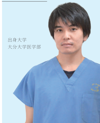
出身大学 大分大学医学部

大分岡病院を選んだ一番の理由は先輩に勧められたからです。また、病院見学での医局の雰囲気の良さも、研修を決めた理由の一つです。大分岡病院は、研修医が多くないため、手技をする機会が他の病院と比べると多く、指導医の先生方が研修医にかける密度も高いように感じます。また、診療科の隔たりが少なく、気軽に相談できるのが良い点です。実際に研修してみると、他科の先生に相談することが少なくないので、すごいメリットだと思います。興味を持った方は是非当院に見学に来て肌で感じていただくと幸いです。