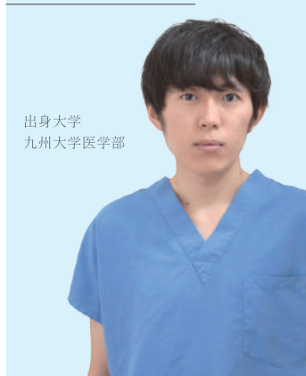
出身大学 九州大学医学部

大分岡病院での研修を開始してから1年が経過しました。この1年は新たな人達との出会いがあり、医師として、社会人として、新たな経験をたくさんし、学生時代がはるか昔のように感じられます。当直も本格的に始まり、自分で責任を持つ場面が増えましたし、1年前と比べるとできることもかなり増えたように思います。大分岡病院では、自分で治療プランを考える機会や手技ができる機会が多いですし、2年間で本当に色々なことができるようになると思います。ぜひ一度見学に来られてください！