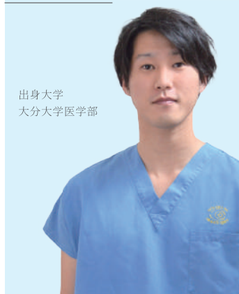
出身大学 大分大学医学部

大分岡病院での研修が始まり、1年がすでに経ったとは思えないほど充実した研修の日々を過ごしています。二次救急ならではの症例を多く経験でき、診察や手技などを実践的な形で指導で、研修医がなるべく多くのことをできるようになっています。指導医の先生方からは、外来での対応のみでなく、病棟での対応、またカルテの使い方など丁寧に指導していただけます。