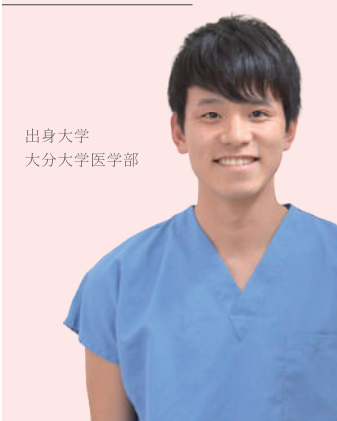
出身大学 大分大学医学部

研修が始まり2カ月が経ちましたが、心から大分岡病院を選んでよかったと思います。まだ、右も左も分からない研修医ができることには限りがある中で、我々研修医のどんな質問に対しても指導医の先生方、他部署の方々は真摯に答えてくださいます。さらに多くの手技、診療を研修医が主体となって経験させてもらえます。知識のなさで恥じるような雰囲気は一切ありません。己の意識さえあれば様々な経験を培うことができ、その環境が大分岡病院には整っています。2カ月の研修で、既に日々の成長を実感できていて、充実した日々を過ごせています。ぜひ見学に一度きて、当院の雰囲気の良さを知ってください。