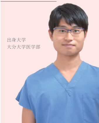
出身大学 大分大学医学部

研修医生活は日々新たな経験の積み重ねです。学生時代は、先輩Drのやっているところを見るだけでしたが、研修医は実際にやってみることになります。Try and Error...ではマズイですが、そうならないように私たちをサポートし、指導して下さる頼れる素晴らしいスタッフが大分岡病院には揃っています。恐れず慌てず謙虚に果敢に、tryしていきましょう。ガッツあふれる研修をしたい人、己を鍛えたい人にはお勧めの研修病院だと思います。学生生活を存分に謳歌したら、大分岡病院で研修をして、『無限の彼方へ、さあ行くぞ！』