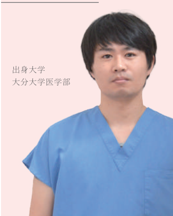
出身大学 大分大学医学部

私が大分岡病院に勤務し始めて早いもので2カ月近くが経とうとしています。学生の頃の大分岡病院のイメージは外科系が強い、循環器が有名、忙しいといった感じでしたが、実際に働いてみてまさにその通りでした。大分岡病院のいいところは先生方や看護師さん、その他の医療関係者の方々が本当に親切で優しい、アットホームな雰囲気なところです。病床数は決して多くないですが、チームとして一つにまとまっているので、自分がまわっている科とは異なる分野の知識を同時に学べることも魅力の一つです。