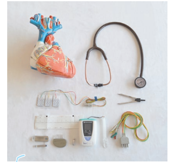
5 5病棟 心臓血管外科 循環器内科