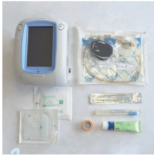
2 2病棟 形成外科 救急科

大分岡病院には8つの看護単位があり、2次救急指定病院・地域医療支援病院で、多くの救急患者や、紹介患者の受け入れを行っています。外来受診から、入院、手術、治療、退院まで、全部署で協力し、患者さん第一の看護を目指しています。