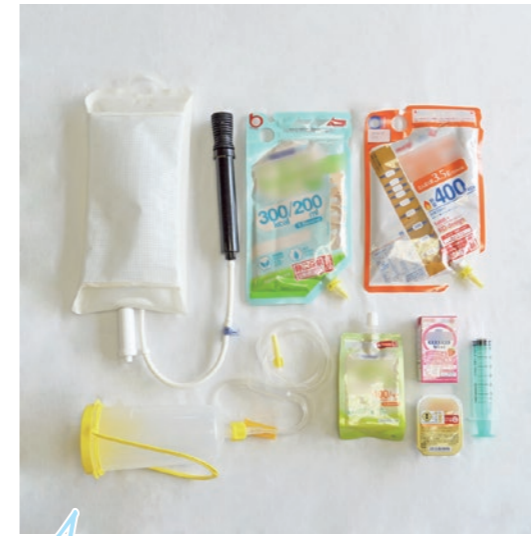
4 4病棟 消化器外科 消化器内科 マキシロフェイシャルユニット (口腔顎顔面外科・矯正歯科)