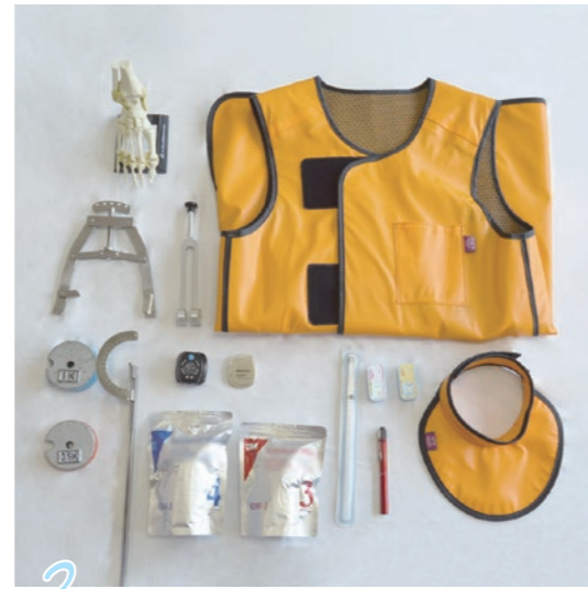
3 3病棟 整形外科 脳神経外科 放射線科(サイバーナイフ)