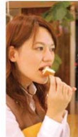
▶切ない秋のしっとりしたティータイムに・・・疲れたココロをそっと癒してくれるお店です