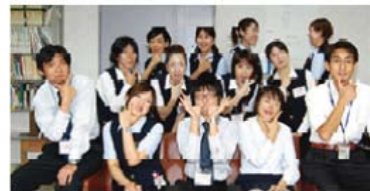
▲なかなか患者さんたちと直接交流のできない部署ですが、みんな面白くていい方ばかりですよ。こう見えて仕事はカンペキです!(もちろん、ボクもですけど!)