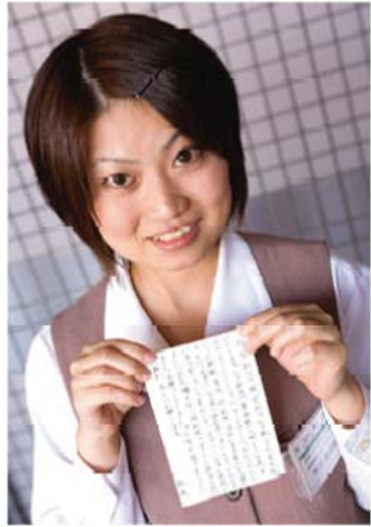
〈広報・マーケティング部〉

地域の皆さまの笑顔と安心のために…。 職員一人ひとりが“おかのかお”であると自覚したサービスを心がけています。