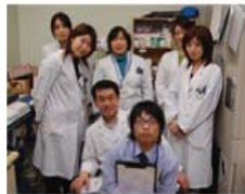
◀薬剤部のみなさん。頼りになるプロフェッショナルばかりです