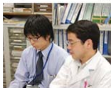
◀やや古田選手似の安長部長に取材するボク。「やっぱりロクせは、代打、オレ!ですか?」(ホントはちゃんと取材してます!)