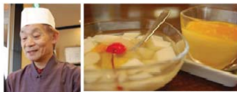
▲中華デザート「杏仁豆腐」と、サービスメニューが大好評で、正式メニューに昇格した「マンゴープリン」どちらも女性に人気です