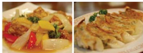
▲40年間変わらない味を保つ「酢豚」は、▲外はパリッ、中は具がぎっしりつまった餃子は、隠し味のミョがポイントなのだそう 甘酸っぱい秘伝のタレが絶品です