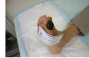
糖尿病、大腿動脈完全閉鎖を伴う右第1趾壊疽