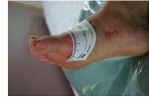
術後3カ月、再発なし