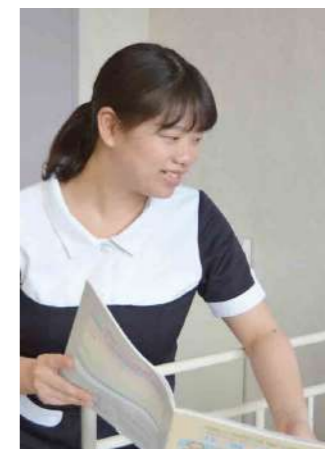
メディカルソーシャルワーカー