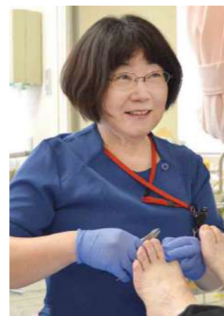
皮膚・排泄ケア認定看護師