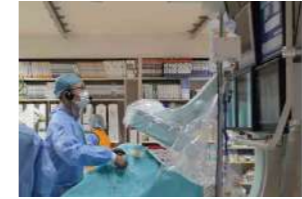
大腿動脈をカテーテルで治療