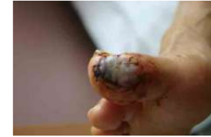
血行改善後に植皮術