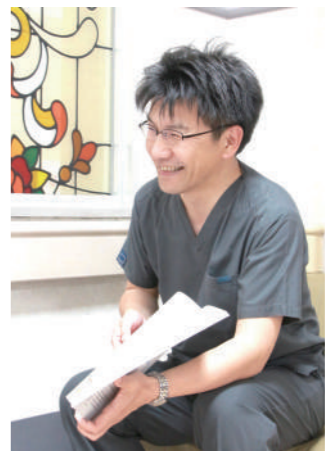
メディカルソーシャルワーカー