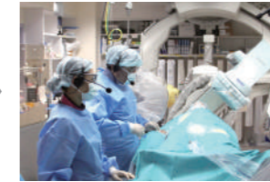
大腿動脈をカテーテルで治療