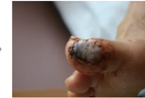
血行改善後に植皮術