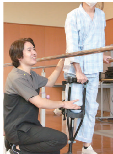
アイウォークでの歩行訓練