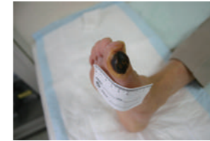
糖尿病、大腿動脈完全閉鎖を伴う右第1趾壊疽