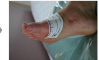
術後3カ月、再発なし